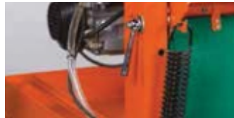
ARC DE COMPENSATIE