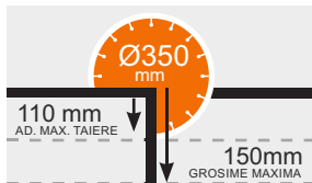
ADANCIME MAXIMA TAIERE