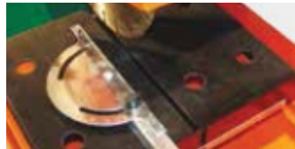
GHIDAJ DE TAIERE VARIABIL